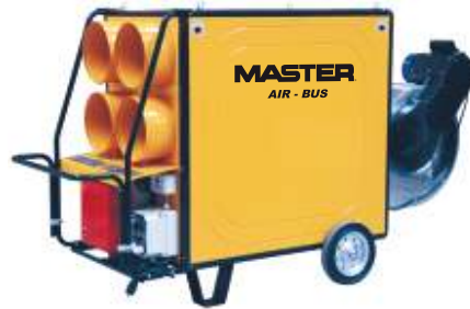
BV 470 FSR