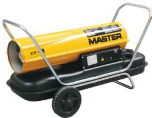
B 100 / B 150 CED