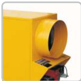
Pannello mandata aria 1 via per AIRBUS 600 mm (BV 470) - 4514.097 700 mm (BV 690) - 4514.093