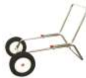
Carrello solo per modelli: B 35, B 70 4103.925