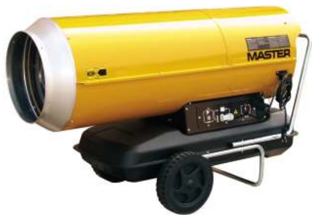
B 230 / B 360