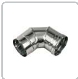
Curva scarico fumi 90° in acciaio inox Ø 120 mm (BV 77) - 4013.261 Ø 150 mm (BV 110-290) - 4013.247 Ø 200 mm (BV 470, BV 690) - 4013.248