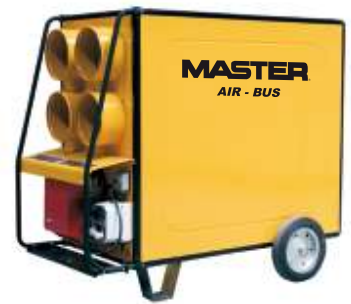
BV 470/690 FS