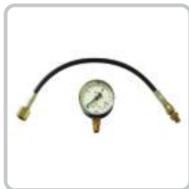
Manometri 0-0,6 bar - B35, B70, B100, B150 - 4109.427 0-16 bar - for the high-pressure oil heaters - 4109.435