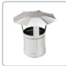
Camino scarico fumi in acciaio inox Ø 120 mm (BV 77) - 4013.262 Ø 150 mm (BV 110-290) - 4013.249 Ø 200 mm (BV 470, BV 690) - 4013.250