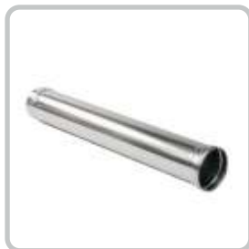
Tubo scarico fumi in acciaio inox 1m Ø 120 mm, 1 m (BV 77) - 4013.260 Ø 150 mm, 1 m (BV 110-290) - 4013.243 Ø 200 mm, 1 m (BV 470, BV 690) - 4013.245