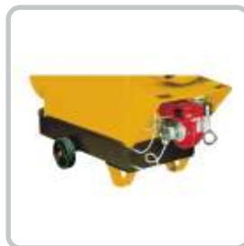
Serbatoio gasolio per AIRBUS BV 470 - 4514.098 - 135 dm 3