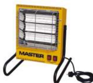
TS 3 A