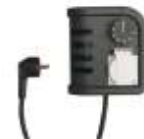
Termostato ambiente TH 2 Con cavo: 0-36°C Sensibilità intervento: ± 1,5°C 4100.426