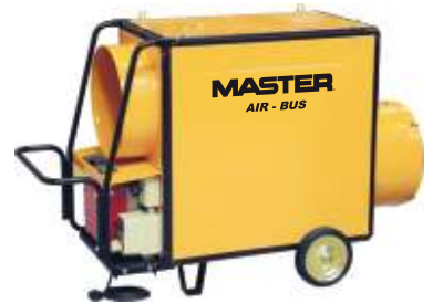
BV 310 FS