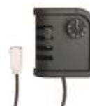
Termostato ambiente TH 5 con cavo Range: 0-36°C, Sensibilità intervento: \pm 1,5^\circ\text{C} 4150.105