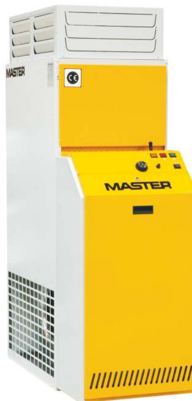
BF 35 - 105