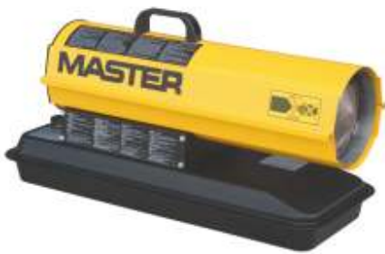
B 35 / B 70 CED